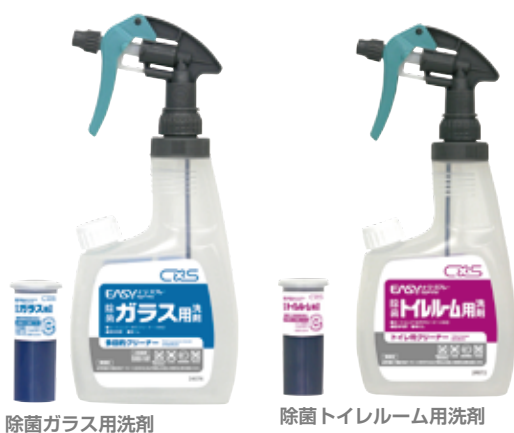
除菌ガラス用洗剤