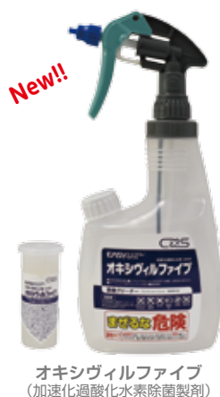
オキシビルファイブ (加速化過酸化水素除菌製剤)

イージースプレーは、1本のカートリッジに2.4L (600mL容器×4本) 分の濃縮洗剤を封入しました。経済的で省スペース、そのうえ簡単に希釈できる画期的なスプレー型洗剤シリーズです。