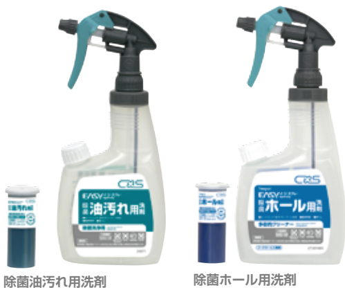
除菌油汚れ用洗剤