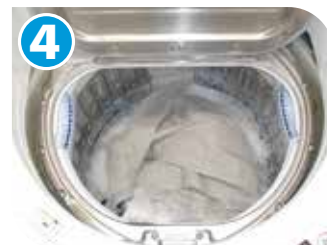
4 洗濯機を運転する。