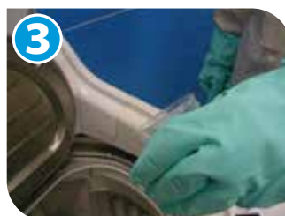
3 洗濯機に洗剤を入れる。