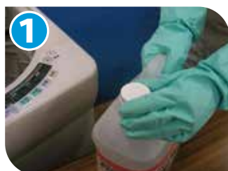
1 キャップを緩める。