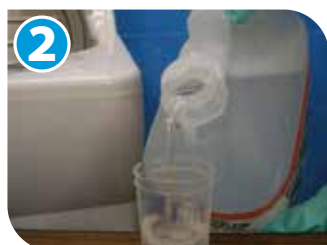
2 メジャーカップに洗剤を適量とる。