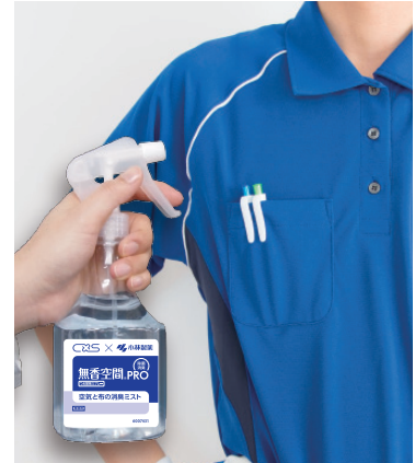
衣類・ユニホームに